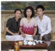
• 伟群、晓虹与两个孩子 • 伟群与晓虹