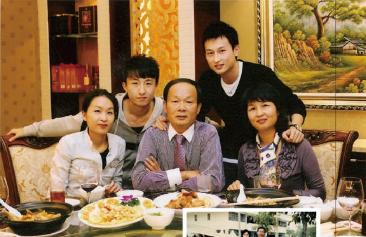
年轻时的“富二代”，现在的孩子长大了，多幸福啊！看看那表情。