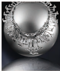
张旭瑞设计作品“觉止”入选国际珠宝设计推广大会