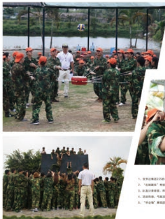
1. 拓展训练中团队合作和团队凝聚力训练 2. “鹰阵计划”精英计划启动暨启动仪式 3. 拓展训练热身,热身操 4. 拓展训练,气氛热烈 5. “毕业季”拓展训练挑战150挑战成功

企业文化发展的同时,对团队的建设与管理也提出了更高要求。2018年,宝亨达集团加大培训投入,加强了与高校、院校、培训机构的合作,充分利用外请讲师和特聘资源,为各岗位员工量身定制了培训计划,其中,为高层管理者制定了“精英计划”,并邀请中山大学EMBA高级课程,针对中基层管理者制定了“精英计划”,促进管理技能提升;还有生产部门“鹰阵计划”也将继续推进,生产部门“鹰阵计划”生产力综合提升训练营,这些专项培训课程30多场,均已如期开展,此次拓展训练作为“精英计划”中的一个课程,得到了良好效果,收到了好评效果。内容干货,形式多变的培训让全体员工更有许多学习提升的机会,也带动了整个团队的凝聚力和向心力,为宝亨达集团的长远发展奠定坚实的基础。