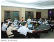
龙岗区仲裁院领导一行表示：“宝福珠宝”是龙岗区珠宝业的龙头企业，也是龙岗区珠宝业的龙头企业。

龙岗区仲裁院领导一行表示：“宝福珠宝”是龙岗区珠宝业的龙头企业，也是龙岗区珠宝业的龙头企业。宝福珠宝园是龙岗区珠宝业的龙头企业，也是龙岗区珠宝业的龙头企业。宝福珠宝园是龙岗区珠宝业的龙头企业，也是龙岗区珠宝业的龙头企业。