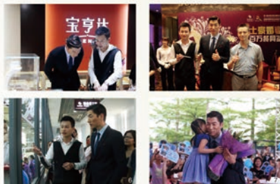
1. 张亮与珠宝园总经理薛晓晨合影，张亮赠送宝福珠宝园三大游览线路启动礼物 2. 张亮获赠宝福珠宝园私人订制礼物 3. “张亮”专属定制“永恒戒指”张亮获赠宝福珠宝园 4. 两大男神张亮与珠宝园总经理薛晓晨合影 5. 张亮获赠宝福珠宝园私人订制礼物 6. 张亮获赠宝福珠宝园私人订制礼物 7. 张亮赠上宝福珠宝园礼物

随后，宝福珠宝园总经理“珠宝沙皇”薛晓晨向张亮赠送一枚戒指，这是“中国铂金第一家”宝福珠宝为张亮专属定制的戒指，刻有“Forever”字样，代表张亮对张亮的心意与祝福，也代表着粉丝们对张亮永远的期盼。