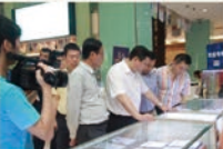
宝福珠宝园为游客建设开放的景点达20多个

宝福珠宝园自2009年开园并首次举办文博活动以来，共接待国内外客商和游人超过40万人次，参观和交易额达6000多万元。高标国际文博这个优质平台，为行业交流提供良好契机，为“深圳国家”品牌国际化、市场化和国际品牌化提供一个良好的方向导航，帮助珠宝产业创新发展。