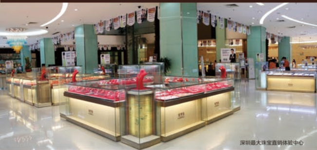
深圳最大珠宝直销体验中心