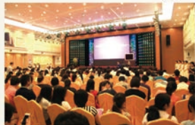
5月16日，第十届文博会宝福分会会场隆重开幕

本届开幕式由中国珠宝玉石首饰行业协会、深圳市黄金珠宝首饰行业协会、深圳市珠宝联盟主办，广东省珠宝玉石行业协会协办。深圳市宝福珠宝有限公司承办。