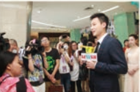
广东省旅游发展局局长陈善广在致辞

宝福珠宝园升级“珠宝文化+旅游”精品线路取得了突破成果。成功获评“国家AAA级旅游景区”，成为深圳唯一以珠宝文化为特色的旅游新业态。景区将与中国旅游集团合作发展宝福珠宝园，弘扬博大精深的中华文化，推动全国首个珠宝生产旅游通道，打造国内“一站式珠宝生产工厂”的标杆，向市民展示全程展示珠宝首饰的每一道工序。