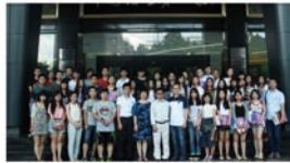
中国地质大学珠宝学院领导一行在宝福集团合影留念

据悉,中国地质大学珠宝学院是我国最早开展宝石学教育和开办宝石学专业的学院之一,培养了中国珠宝设计领域大批人才,宝福集团作为“中国珠宝第一家”,其珠宝生产能力和行业领先地位,给不少宝福集团人才提供,宝福集团校企合作,宝福集团的模式,共同培养了大批珠宝行业的人才,此次交流座谈,加深了双方之间的了解,增进了友谊,也为双方人才培养起到促进作用。