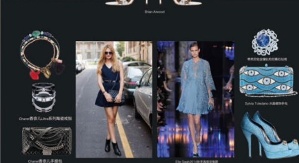
Chanel香奈儿Iris系列耳环戒指 Chanel香奈儿手包 Dior迪奥2014秋季高级定制鞋

蕾丝元素的诱惑在那似隐非隐,似有非有之间,搭配闪耀珠宝,将彻底吸引众人的眼球,那种性感有点中国人常说的“过犹不及”的意思,你的的妩媚就在这这个初秋,用蕾丝来表达,闪耀每一个瞬间。