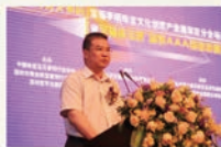
广东省旅游发展局局长陈善广在致辞