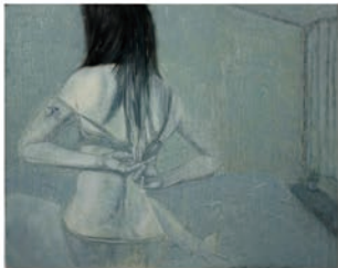
图6 (C) 作者刘大为 编辑 2006.1