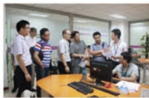
2014年8月21日，深圳市珠宝商会组织珠宝企业代表参观宝福公共技术服务平台，现场交流了平台运营模式、运营模式、运营模式及运营模式等生产运营，探讨了珠宝企业转型升级的运营模式。